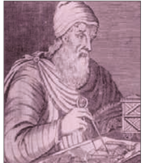
Arquímedes de Siracusa

En esta pequeña historia no podemos olvidar a Apolonio de Perga (262-190 a.C.). Su mayor contribución geométrica está contenida en su obra Cónicas , donde estudia las curvas que resultan al cortar planos con superficies cónicas.